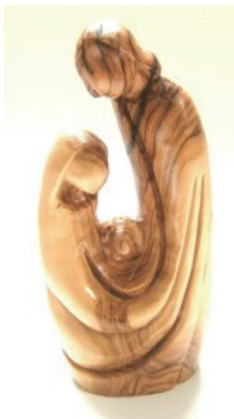
Artesanía realizada en Belén